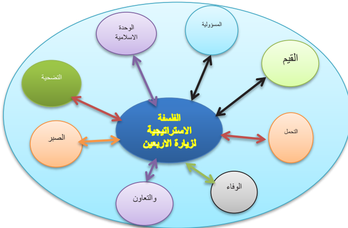
الشكل رقم (٢) يبين الفلسفة الاستراتيجية لزيارة الأربعين